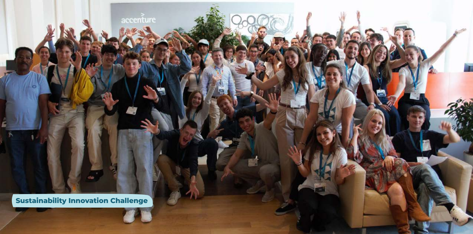
Sustainability Innovation Challenge