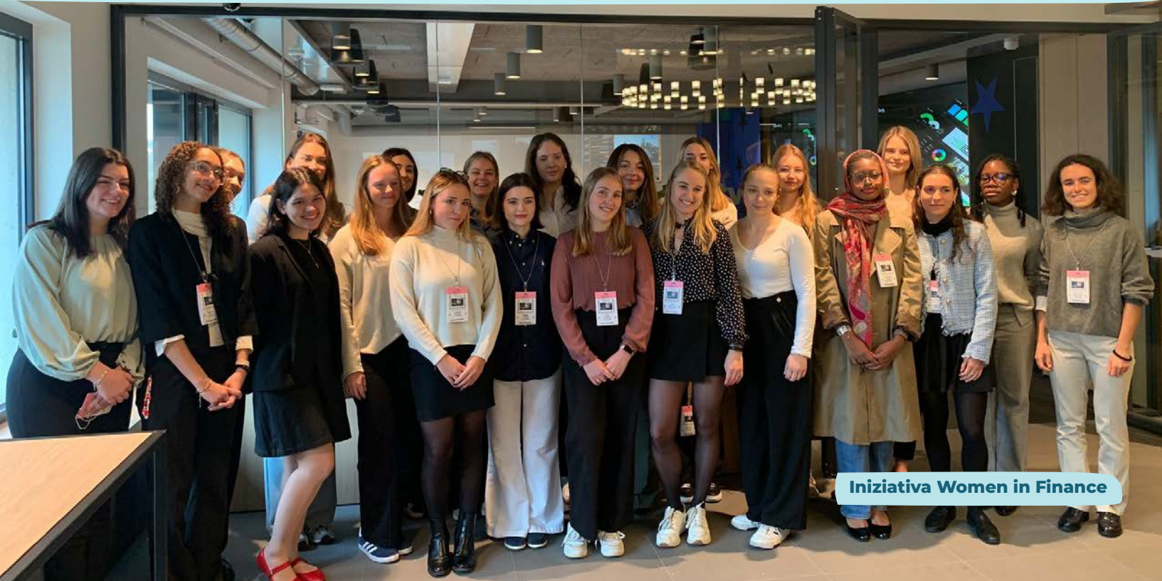
Iniziativa Women in Finance